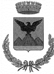
MONTE SAN BIAGIO