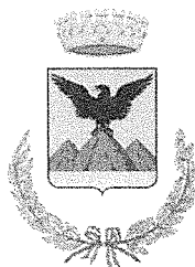
MONTE SAN BIAGIO