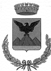
MONTE SAN BIAGIO