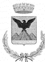
COMUNE DI MONTE SAN BIAGIO